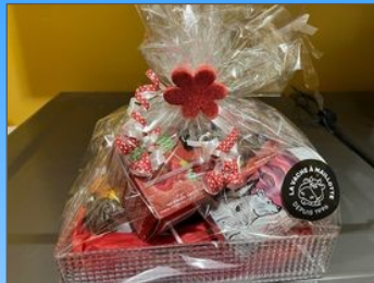
Panier cadeau de la fromagerie La vache à Maillotte.

VALORISER LES PROFS, ÇA DOIT ÊTRE UNE PRIORITÉ TOUTE L'ANNÉE. ILS SOUHAITENT DES GESTES CONCRETS DE LA PART DU GOUVERNEMENT, PAS UNIQUEMENT DES REMERCIEMENTS.