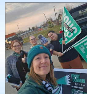
Notre visibilité au conseil municipal de Chapais le 16 mai 2023